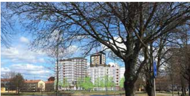
Illustration av den föreslagna höghusbebyggelsen vid Sundstatjärnet. Detaljplanen är nu inne i granskningsskedet då föreningen kan lämna ytterligare synpunkter.

I samrådsyttrande 2015-09-02 framförde föreningen kritik mot detaljplaneförslag för Sundsta torg. Planen syftar till att möjliggöra förtätning med fem höghus med mellan sju-till sjutton våningar och skapa en ny stadsmiljö i form av ett urbant torg vid södra delen av Rudsvägen. Föreningen riktade främst kritik mot att ytterligare exploatering tillåts på mark inom strandskyddet för Sundstatjärnet samt förordade att det föreslagna åttavåningshuset på den nuvarande bilparkeringen vid södra änden av Drottning Kristinas väg samt elvavåningshuset norr därom stryks ur planen. Ytan borde istället införlivas med parken på Badhussidan som kompensation för förlorade ytor i samband med badhusbygget.