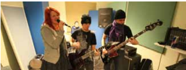
I Musikakuten på Gjuteriet trakteras inte bara instrument. Här kan man också få kunskap om hur man arrangerar musik, skriver låttexter och spelar in musik.

Musikakuten är namnet på den instrumentalundervisning som omfattar både individuell och gruppundervisning i keyboard, gitarr, bas, sång och trummor. Här deltog under året 18 elever. Två fullt utrustade repetitionslokaler och en särskild slagverksstudio med ett antal digitala trumset användes för detta ändamål. Tack vare den digitala tekniken kunde därmed flera utövare spela samtidigt i samma rum utan att störa varandra.