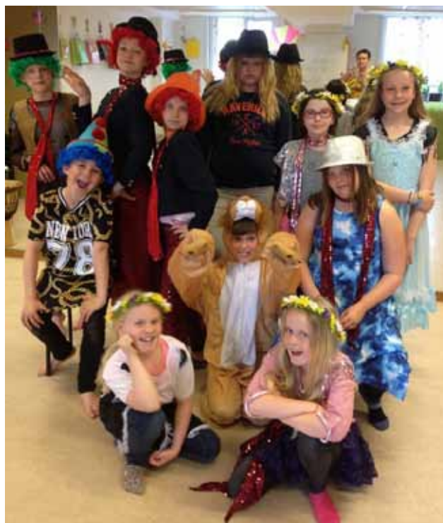
Glada deltagare vid Barnmusikskolans sommarläger 2015.

I Sensus Barnmusikskola deltog nära 200 barn i åldrarna 0-14 år varje vecka i 21 grupper med inriktning på musikal, dans, rytmik och musik samt tre föräldra/barngrupper för de allra minsta. Lokalerna nyttjades även regelbundet av Nyeds Dragspelsklubb. Barnmusikskolan anordnade även sommarläger i juni för 15 barn i åldern 10-12 år.